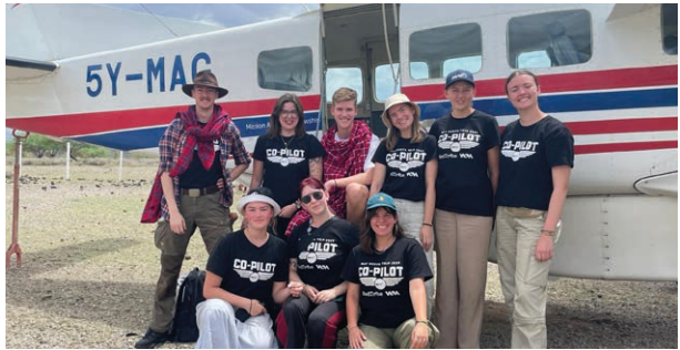
Var femte minut landar ett av Mission Aviation Fellowships (MAF) flygplan någonstans på jorden för att sända ut hjälp till dem som behöver det.

rent. Det var en äkta glädje som hon verkligen har tagit med sig hem. Något som är lika självklart för oss som rinnande rent vatten, är verkligen inte självklart. Det har fått båda systrarna att vara mer sparsamma med vattnet nu när de är hemma igen.