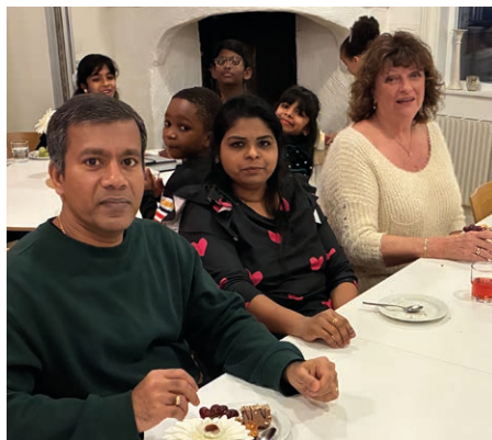
Varje söndag träffas engelsktalande i olika åldrar och från olika världsdelar i Önneredsgården.